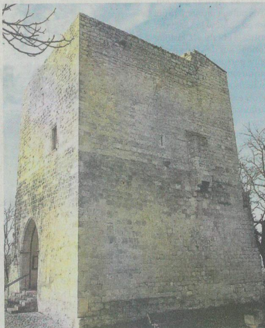
La tour vue de la mairie.